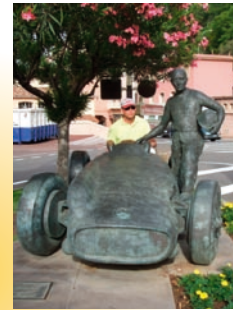
Sitter du i førersetet i eget liv?

Inspirerende Coaching™ er varemerket for coaching som bygger på Ringom-Instituttets kommunikasjons- og følelsesmodell, utviklet gjennom 25 års erfaring med leder- og medarbeiderutvikling. Se www.ringom.no