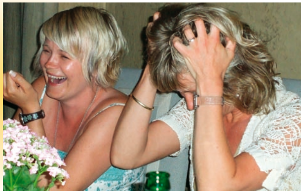
I gode venners lag...

endringer krever coaching over tid, ofte 6-12 måneder. Lengden på hver time, og tiden mellom hver time, avtales mellom coach og coachee. Vanligvis er en coachingtime 60-90 minutt. Det kan også gjøres avtale om at coach følger opp coachee pr. telefon mellom timene, dersom coachee ønsker det.